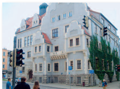
Das Stadthaus ist der Sitz des Bürgerbüros in Apolda.

Vier Jahre lang haben inzwischen die Bürger im thüringischen Apolda das neue Bürgerbüro kennen und schätzen gelernt. Seit Januar 2006 haben die Bürger an sechs Tagen in der Woche eine zentrale Anlaufstelle, um alle Behördengänge zu regeln. Damit erweiterte die Stadtverwaltung ihre Öffnungszeiten um mehr als das Dreifache, und Apolda veränderte sich von der traditionellen Behörde zum modernen Dienstleister. Die Vorteile für die Einwohner liegen auf der Hand: kürzere Wege, geringere Wartezeiten, schnellerer und besserer Service.